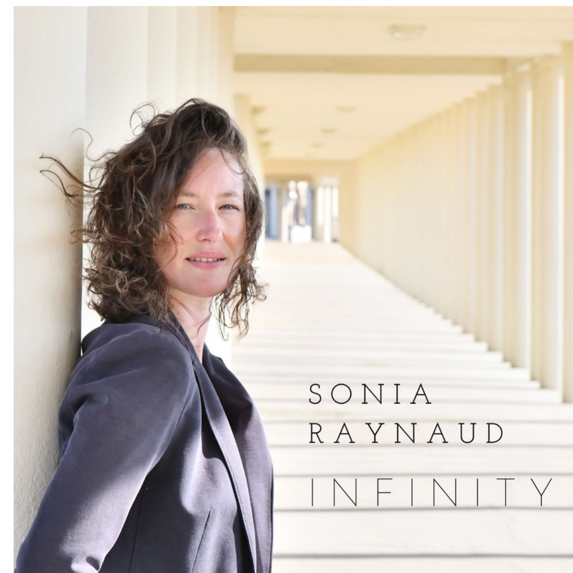
INFINITY Octobre 2021