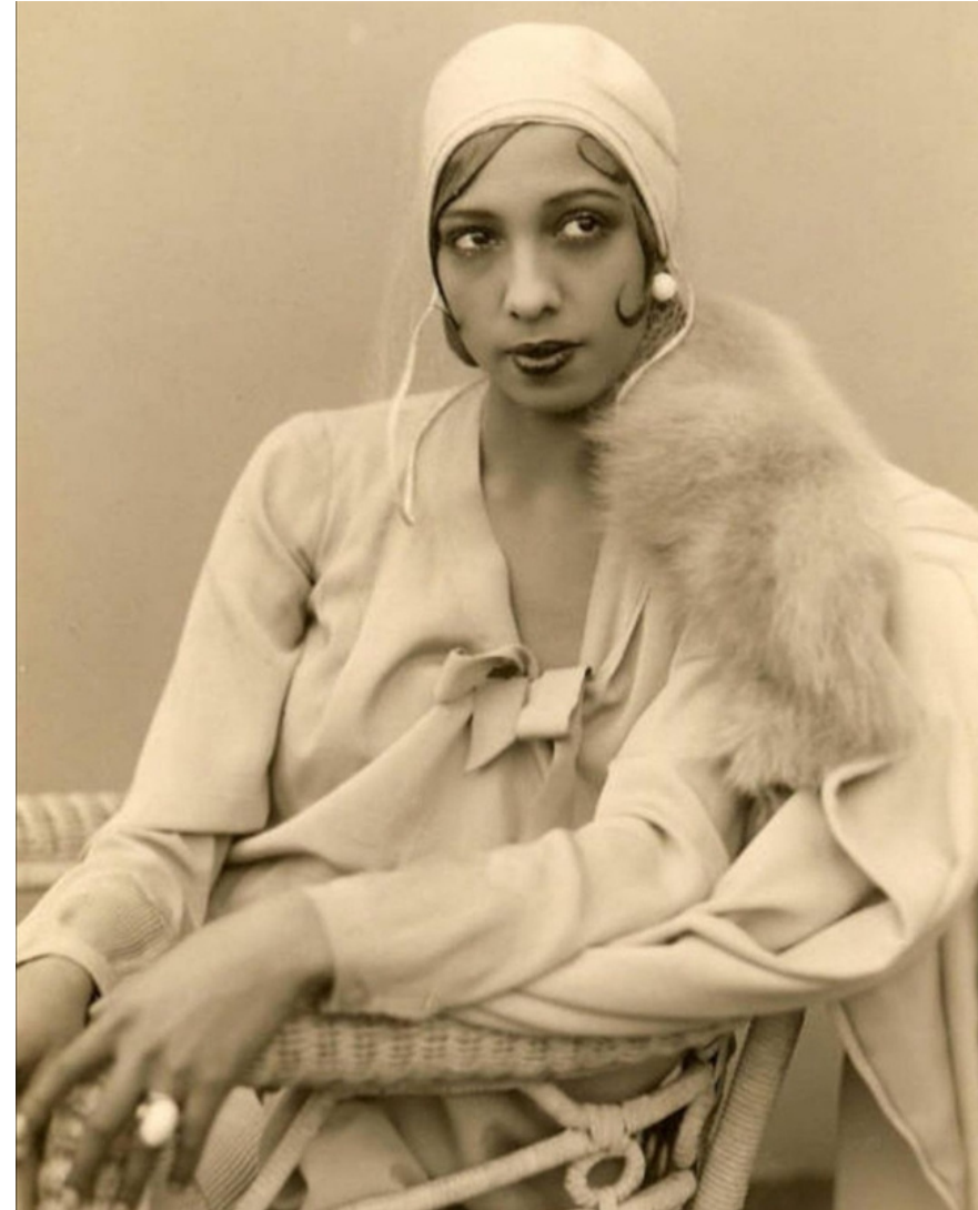
Portrait musical de Joséphine Baker