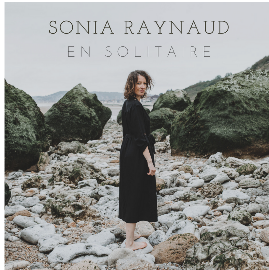
EN SOLITAIRE Janvier 2021