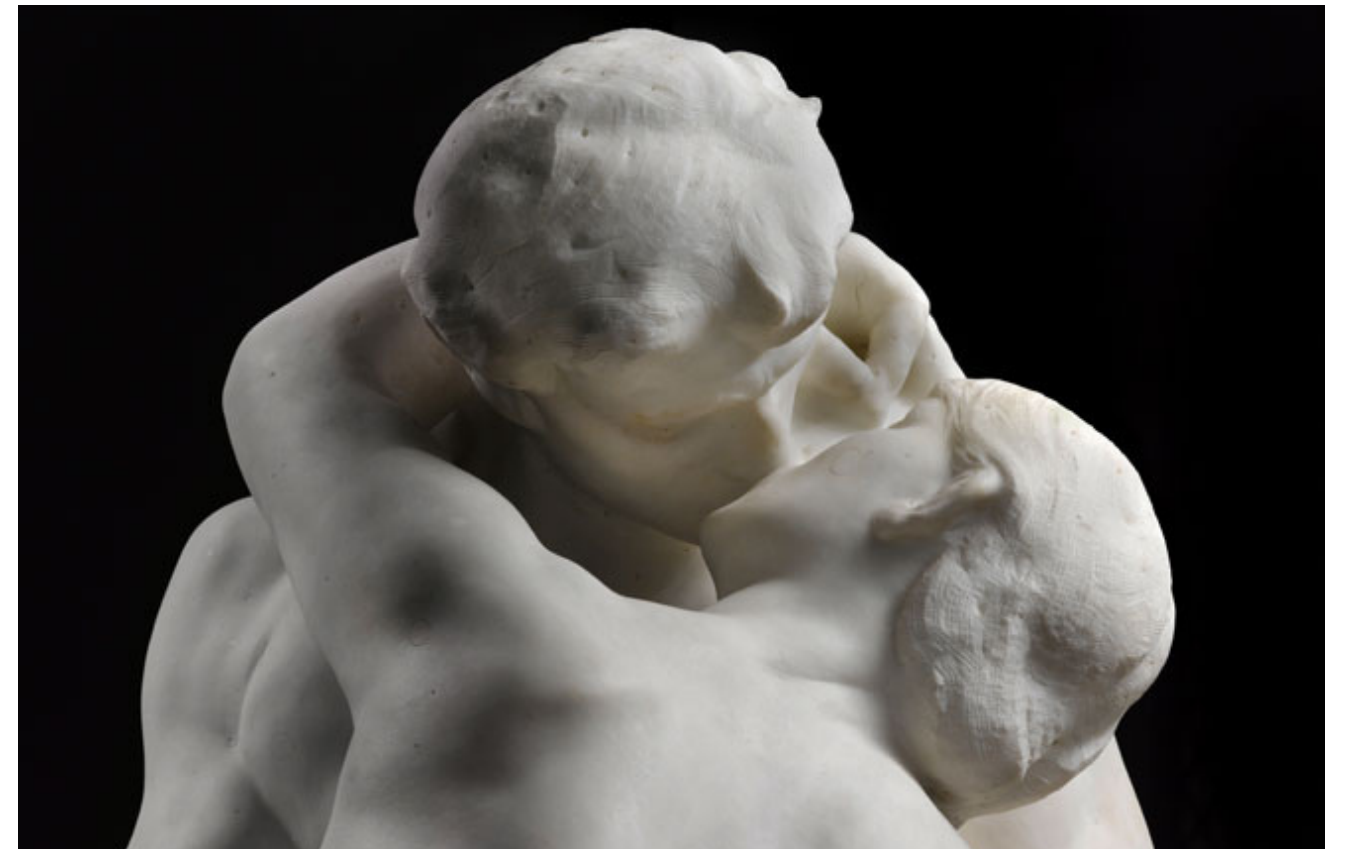
Portrait musical du Baiser de Gustave Rodin